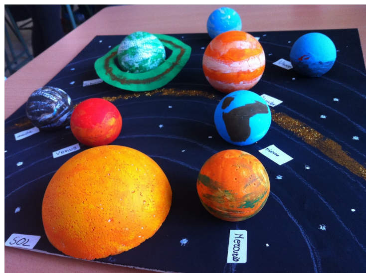
Planetario en tercero de primaria. (Imagen de Campiña).