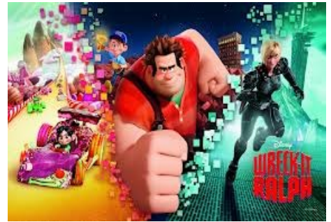
Esta es una imagen de la película "Rompe Ralph".