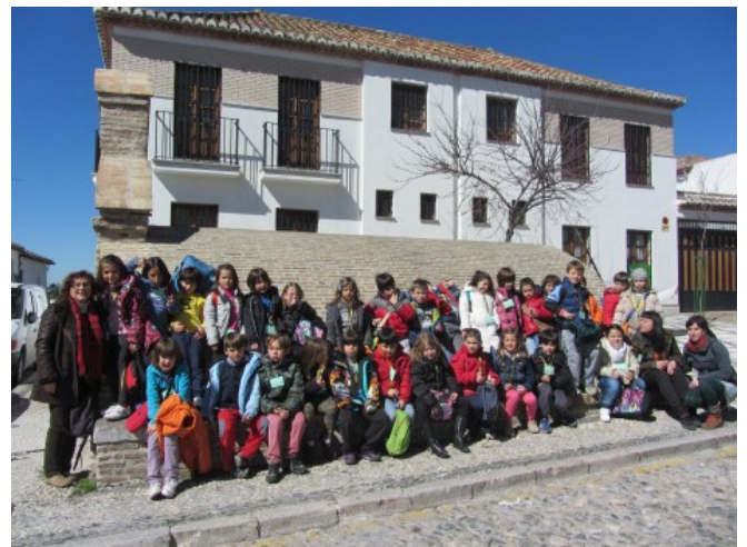
Segundo en un aljibe del Albaicín.

También avisan de que la Iglesia de san Nicolás pudo ser destruida por un rayo