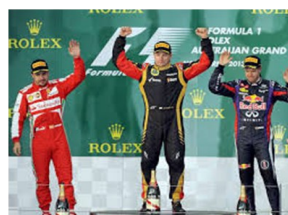
En el podio Raikinen

EL GRAN PREMIO DE AUSTRALIA LO HA GANADO KIMI RAIKONEN, SU COCHE ES UN LOTUS RENAULT. SEGUNDO FUE EL ESPAÑOL FERNANDO ALONSO, CON SU COCHE FERRARI. EL TERCERO FUE SEBASTIAN VETTEL, CON SU COCHE DE RED BULL.