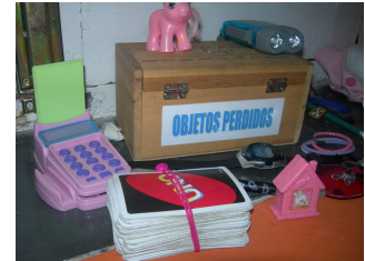
Objetos perdidos en secretaría.

será destinada a una fundación llamada "Madre coraje" para dársela a los niños más desfavorecidos.