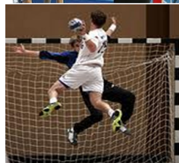
Jugador lanza al portero contrario.