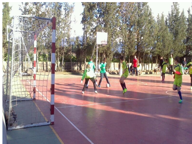
Escolapios ataca a nuestro equipo de Alquería.