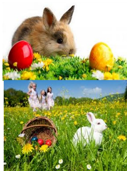
Huevos de Pascua.