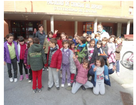
Grupo de 1º en la facultad de ciencias del deporte.