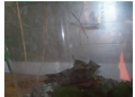
Insecto palo en 2°.