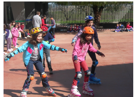
Patinadores del tercer ciclo